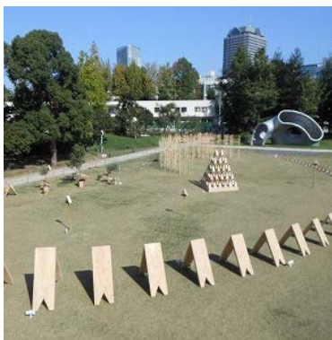
Design Touch Tokyo