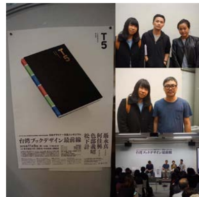
T5 台灣書籍設計最前線論壇 (台灣ブックデザイン最前線)