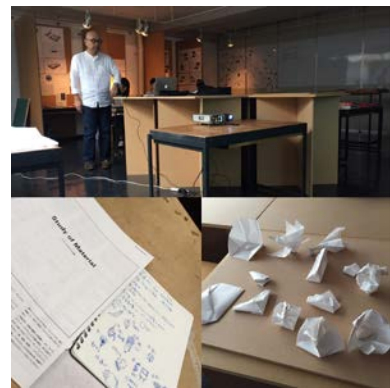
課間講座：材料與包裝概論

後期只有選一門產品設計主修課，所以能單純探究同一項目，並在課餘時間能夠參加許多課外講座、去各大商店研究產品，過得相當充實。來跟台灣的設計教育做比較的話，課程進行基本上是相近的，藉由從事某某行為的過程中觀察不便與待改善的点、大量發想、模型試做、檢討。但日本的设计進行較為嚴謹，凡是依循法則，進度稍為緩慢扎實一些。