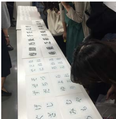
字游工房校內講座：鳥海修

武藏野美術大學內最寶貴的資源就是他們舉辦了大大小小的課外講座，幾乎每隔 1-2 天就有日本知名企業、國內外藝術家、設計師來舉辦講座，可以找自己有興趣的去聽。此外，東京的設計能量也相當活躍，每個季節都會有不同的行銷手法，在街頭就能大飽眼福。例如位於 Tokyo Midtown 內的 Design Hub 就是武藏野和 Midtown 合辦的一個設計論壇空間，每隔 1-2 個月會舉辦武藏野教授的演講。10 月的設計師週也相當精彩，展出了許多互動裝置藝術和各大學的裝置展。也看見許多家長帶小孩來體驗，設計教育從小就開始扎根。位於六本木 Midtown 內的 Good Design 展則是展出日本業界最新得獎作品，並能實際操作，除了產品之外也有平面、企業識別、地域設計等多種類別。去聽了轟永真、何佳興、色部義昭和松下計四位傑出設計師在東京藝大的對談，以及再過不久要在日本出版的 T5 計畫的發表會。在國外抽離熟悉的環境後，才了解到自己國家的文化與設計氛圍有多麼吸引人，在台灣只會一味羨慕日本設計環境的成熟 & 尊重專業，但其實台灣現在這種充滿不安、不確定性、未定型的設計環境才是每個即將或已經在設計界的人需要去全力推動的。台灣設計師獨有的感性面也是只有在這個充滿豐沛感情的島國才能孕育的。雖然台灣與日本都是漢字文化圈的一員，由不同文化土壤根基出來的作品真的差異很大，讓人覺得兩方的交流的過程是充滿魅力火花的。