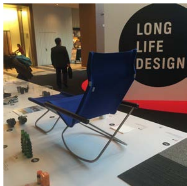
Good Design 展