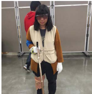
通用設計：高齡者體驗課程