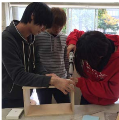
藉由製作書架發現操作過程中的不便