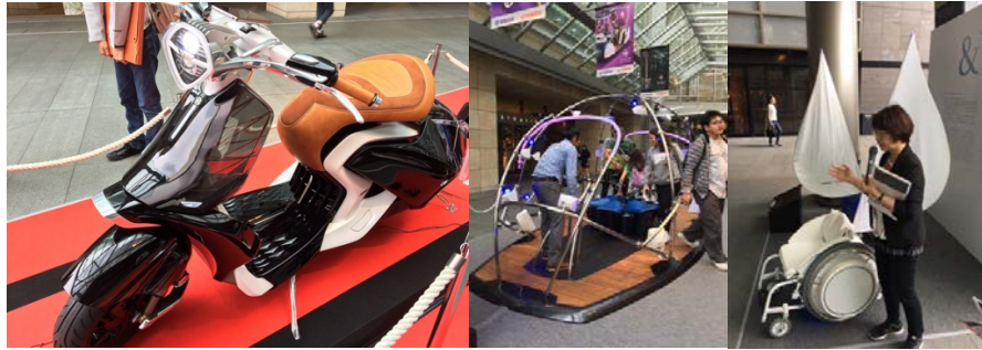
(圖左) 我和設計師討論的速克達 (圖中) 聲音互動裝置 (圖右) 輪椅樂器與解說