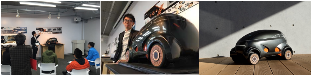
(圖左) 期末發表 (圖中) 我與作品 (圖右) 產品照