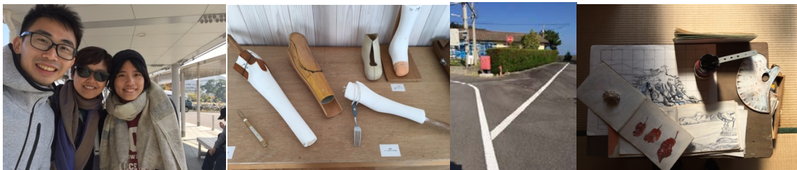
(左一) 這趟旅程遇到的人 (左二) 大島居民生活器具 (右二) 路中央引導線 (右一) 居民繪具

趁著藝術季假期，投向南國陽光與海的擁抱，抓住了三年一次瀨戶內海藝術季的尾巴，在秋季期間走遍了 10 座島嶼，一覽無限的山海美景與各種驚艷的大型藝術創作，與當地樂活的居民一同感受這裡的陽光與漂浮在字裡行間那種殷勤與歡愉。一個人旅行，能放下身旁的包袱，並且有更多時間思考，也遇見了住同旅社的香港背包客以及來日本打工度假的台灣女孩，然而再多山海美景也比不其中一天去的大島來得印象深刻。大島，曾經是一座孤立麻瘋病人的島嶼，直到近代政策廢止，這些人才享有去留的權利，藝術季規劃團體導覽式進出也是為了不影響留在此地繼續安養天年的長者們，這裡的一切都很有秩序，如同假山假水，城鎮中無時無刻都迴盪著引導人回家的音樂，路面上也繪有如 google 地圖上的引導線，秩序過頭令人不寒而慄，秩序或許是自古以來人們所追求的目標，但物極必反的現象卻在這個被時光遺忘的島嶼上完整呈現，其中發現有許多被設計過來給他們使用的產品，也從他們生活的空間與使用的書籍細細品味了島上曾經發生過的歷史，在藝術作品的美化之下，這座憂傷的島嶼又再度燃起生命。