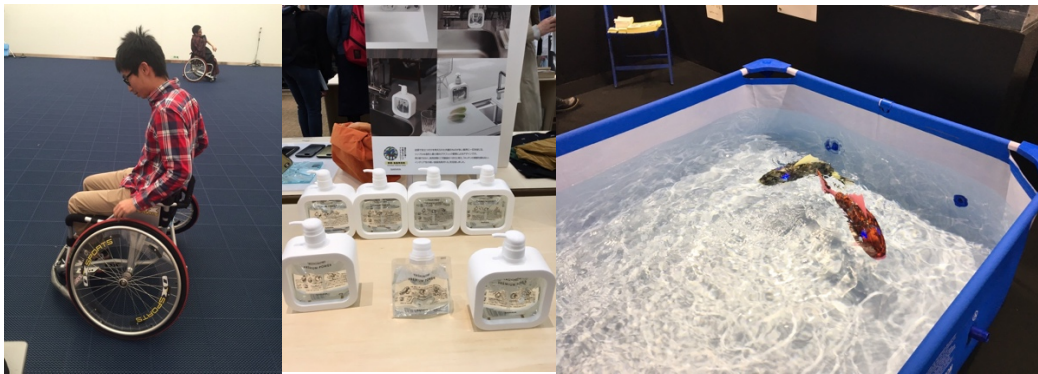
(圖左) 競速輪椅體驗 (圖中) Good Design 設計展 (圖右) 東京設計師週機器魚

東京六本木有非常多展覽，藝術三角也位於此，同時中城裡有武藏美的展覽空間，也有非常多講座在這裡舉行，除了東京之外，無論上山下海，都可以看見地方產業對於文化與設計之間連結的努力。