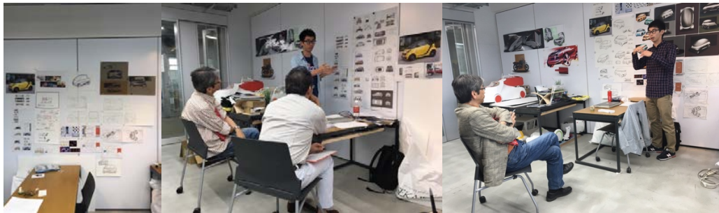
(圖左) 個人工作空間 (圖中) 調查結果發表 (圖右) 概念草圖發表

後期主要的課題是我們必須從歷史中尋找美的元素，進而運用並針對未來自動駕駛時代設計車款。所謂職人養成的計畫表，是以天為單位計算，無時無刻都有發表與討論，在吸收不同的資訊之後統合並做抉擇。在一開始我對於如何客觀評價汽車的美遇到重重難關，討論之後便發現可以用三角形構成法與黃金比來解讀車款，也獲得老師一致肯定。隨後進行概念發想與草圖繪製，老師最常講的一句話就是：不會不好，但是...，我覺得來到日本才真正體會到了不會否定任何想法與可能的這件事，我以往常在偏見中尋找點子，卻忽略設計本質應當是在客觀的環境下去尋找那些能合理化的點子，在這裡，只要你能說服老師邏輯清楚，再怎麼天馬行空的點子似乎都能實現。