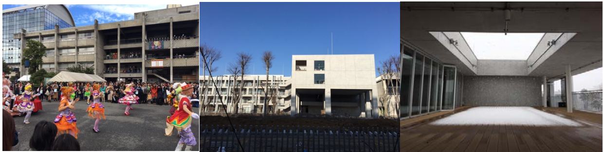
(圖左) 武藏美藝術季 (圖中) 14 號館外觀 (圖右) 系館雪景

武藏野美術大學位於東京都近郊，地利之便使其在水泥叢林中依然能保有大自然簇擁的靜謐，校內建物各有特色，美術館與圖書館的收藏與展覽可謂學生獲取靈感的最佳寶庫，充滿活力的校風在一年一度的藝術季便可略知一二，無時無刻都會有藝術作品在校園中綻放，所遇見的每一個人可能是未來偉大的設計師或是藝術家。菁英計畫的學生加入了工藝工業設計學系這個大家庭，系館為剛落成的清水泥 14 號館，完善的設備與彈性的空間利用令人歎為觀止，從其整潔程度也可以發現日本對於專業的敬重。