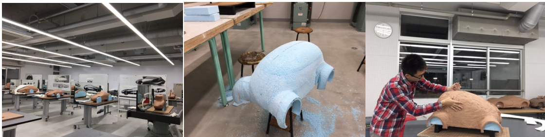
(圖左) 油土教室 (圖中) 木芯製作 (圖右) 油土荒盛階段

第二個課題後半為油土模型製作，從木芯、基座到表面平整、貼膜，過程都有日野汽車的數名業師共同指導，學校擁有專業設備，能在如此完善的設備下進行設計讓我覺得日本學生很幸福，同時環境的整潔也做得很好。期末發表前，我因為將工具放在地板的板子上而被老師斥責，但回頭想想這也是因為他們對於專業的敬重、對工具的敬重以及對設計的敬重，這正是我應當學習的！