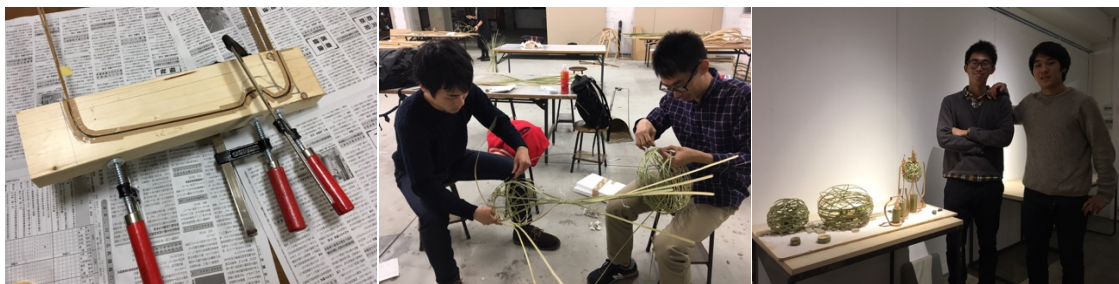
(圖左) 竹片膠合 (圖中) 竹編織過程 (圖右) 期末發表